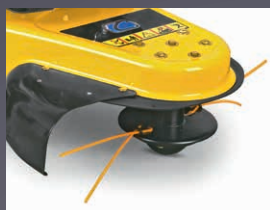
FIL 4 MM (10 FILS INCLUS)