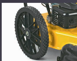
GRANDES ROUES ARRIERE