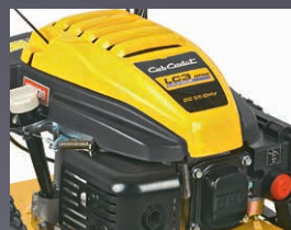
MOTEUR PUISSANT CUB CADET