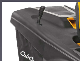
LEVIER DE BAC ESCAMOTABLE