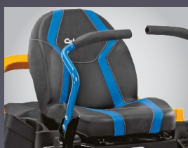
GRAND SIEGE CONFORT