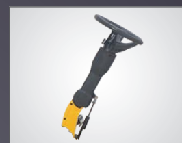
COLONNE DE DIRECTION AJUSTABLE