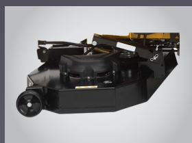
PLATEAU DE COUPE MÉCANO-SOUDÉ