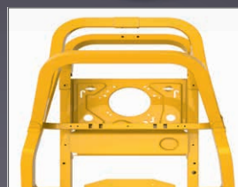
CHÂSSIS TUBULAIRE 38X76 MM