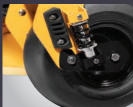
TRAIN AVANT AMORTI