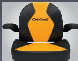
GRAND SIEGE CONFORT AVEC ACCOUDOIRS